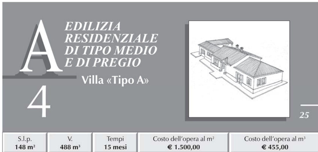
TABELLA RIASSUNTIVA DEI COSTI E PERCENTUALI D'INCIDENZA